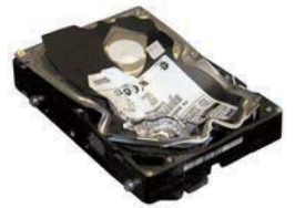
使用SEM 0100型号压碎的桌面电脑硬盘